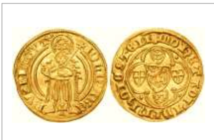
Goldgulden der rheinischen Münzunion http://de.wikipedia.org/wiki/Goldgulden